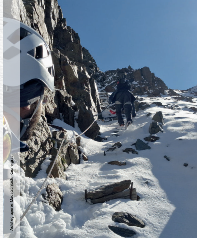
Aufstieg alperes Madatschjoch, Kaunergrat