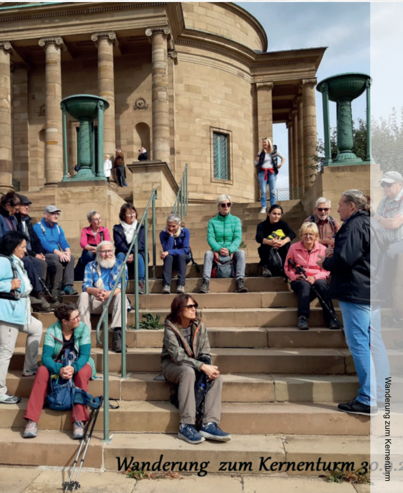
Wanderung zum Kernenturm