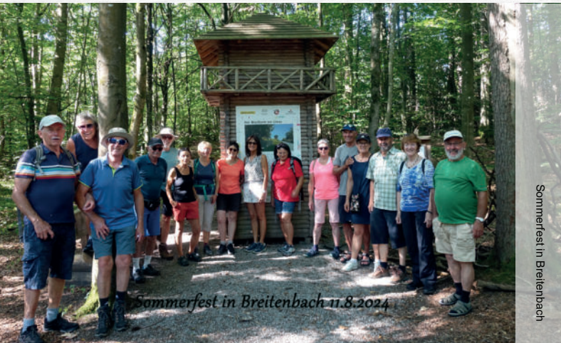
Sommerfest in Breitenbach 11.8.2024