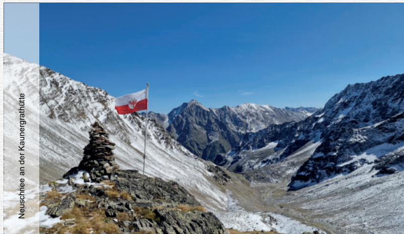
Neuschnee an der Kaunegrathütte