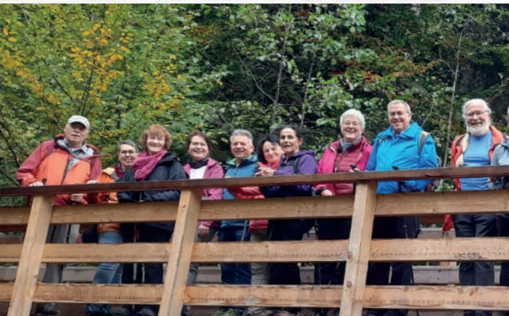
Auf dem alten Schulweg nach Wollstein