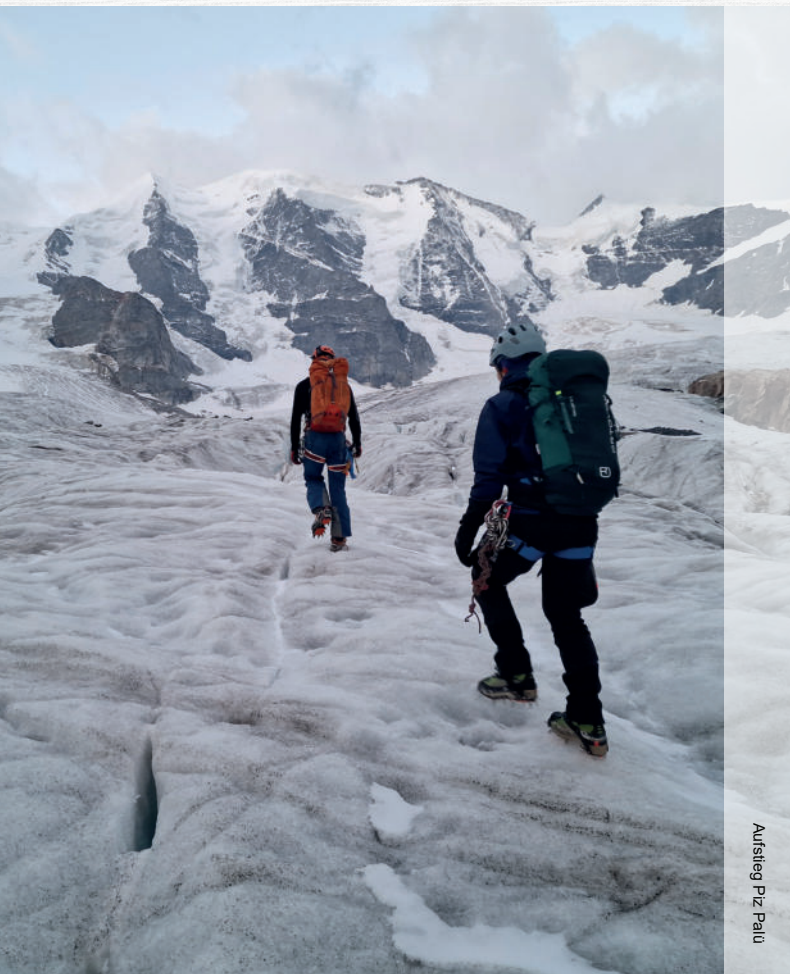
Aufstieg Piz Palu