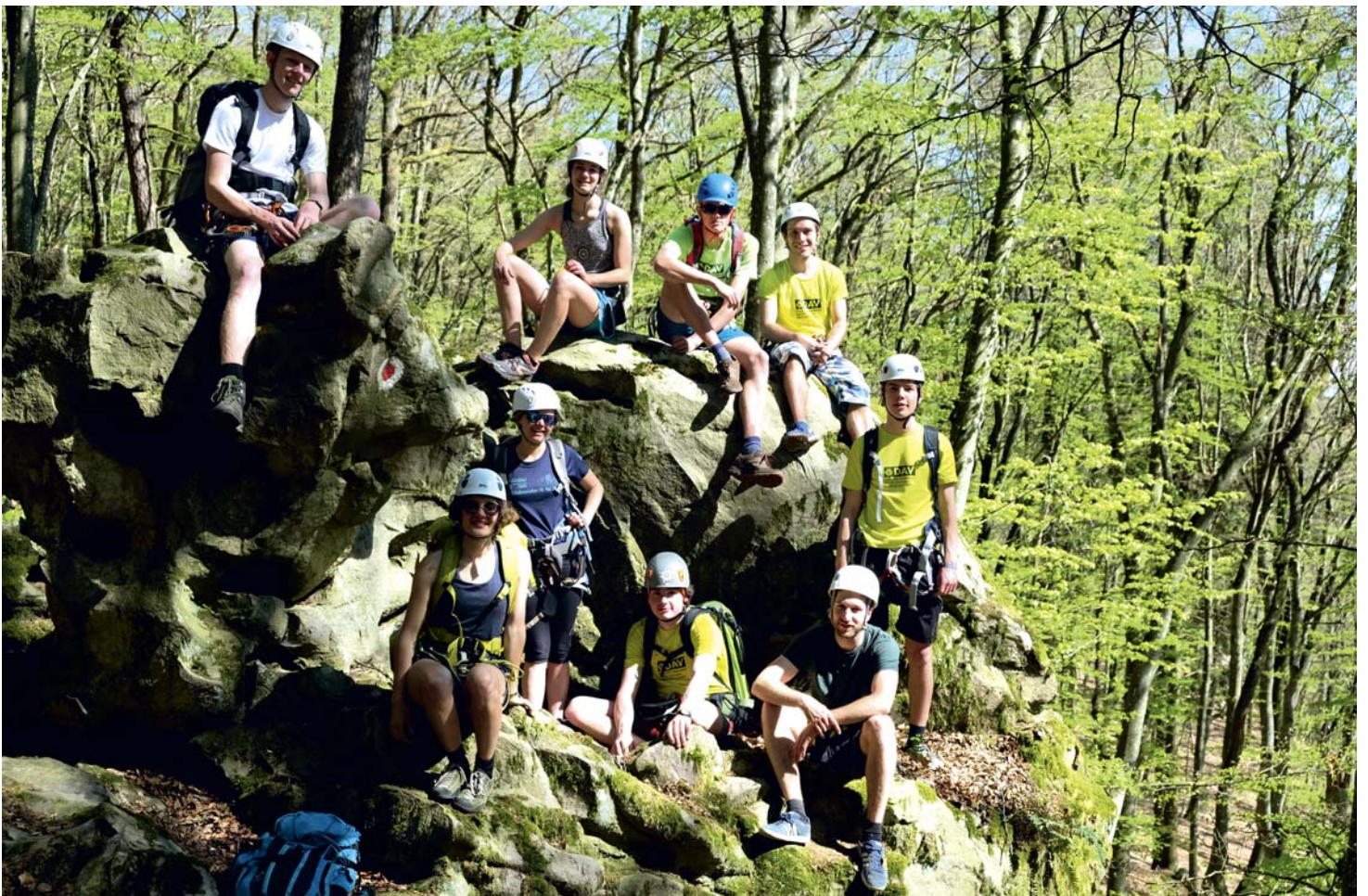
Gruppenfoto zwischen den gesicherten Abschnitten

und machte sich auf den Weg in den Supermarkt, um Proviant nachzukaufen.