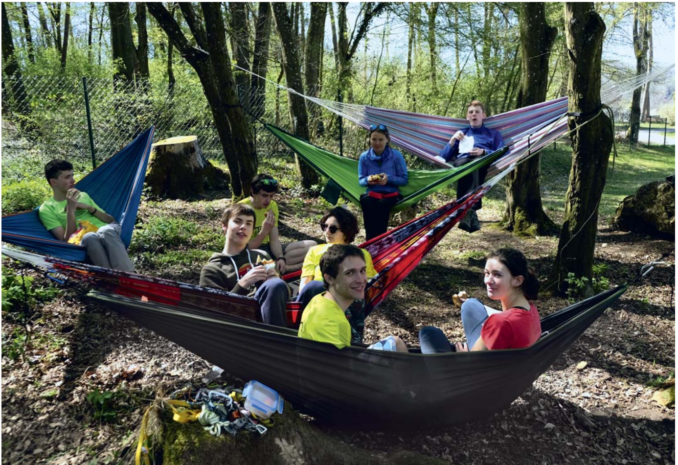
Mittagspause in unserem Hängemattenkonstrukt

Im Vergleich zu gestern überraschte uns dieser mit kurzen Hakenabständen und nur wenig verspeckten Touren. Auch heute kam das Ausprobieren an schweren Touren nicht zu kurz und im angenehm schattigen Wald konnte man schön entspannen. Davor nutzte eine dreiköpfige Einkaufsgruppe noch ihre Gepäcktaschen