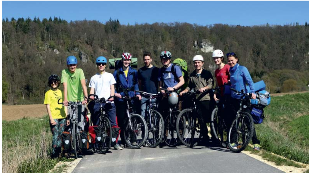
Gruppenfoto auf dem Weg vom Bahnhof zum Zeltplatz

Einige entschieden sich nachts gegen das Zelt und für die Hängematte. In weiser Voraussicht hatten wir auch zwei Zeltplätze zu wenig eingeplant, denn schließlich war das gute Wetter absehbar und zur Not hätte es ja auch noch den Aufenthaltsraum gegeben.