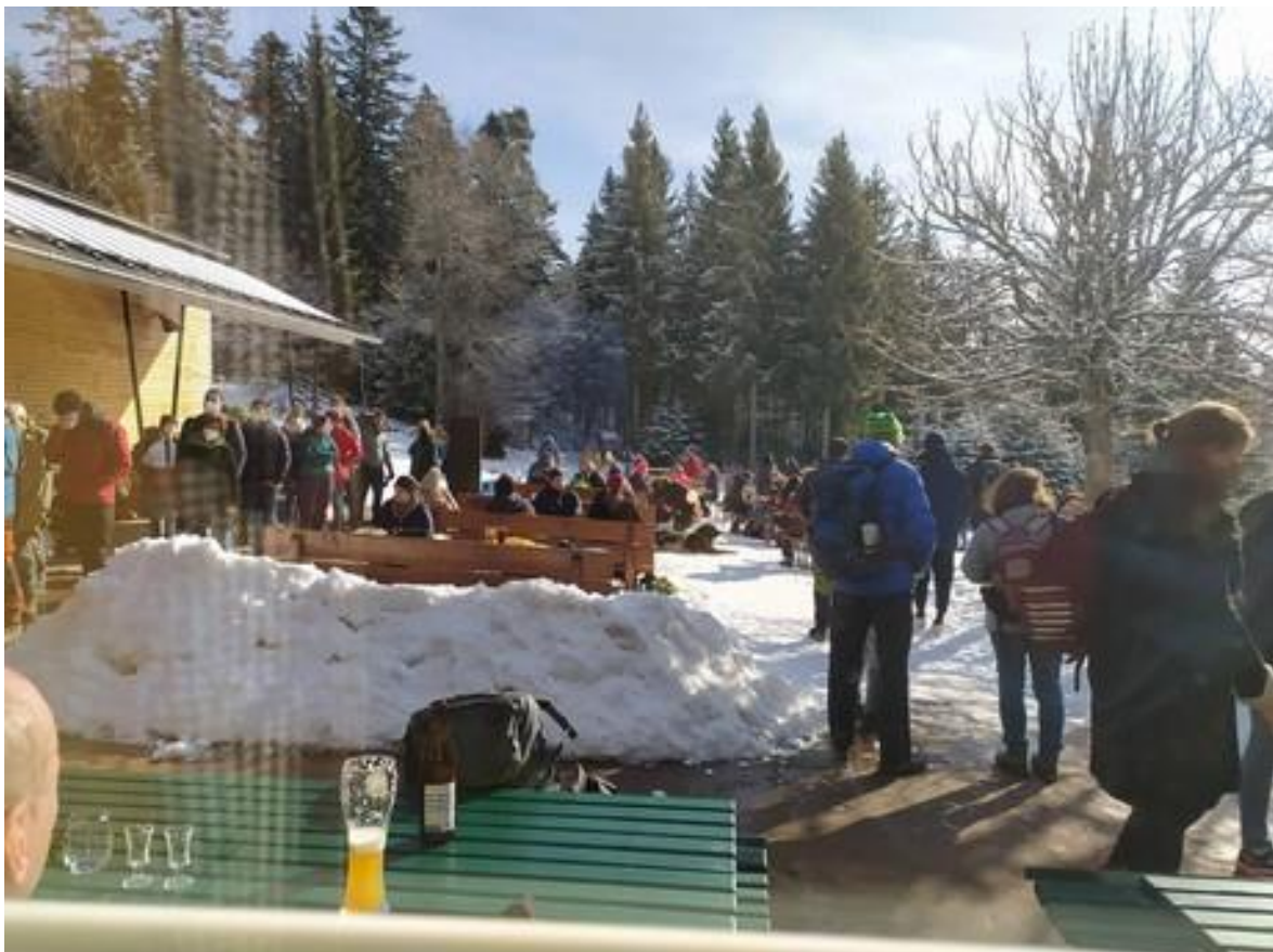
Warten an der Grünhütte