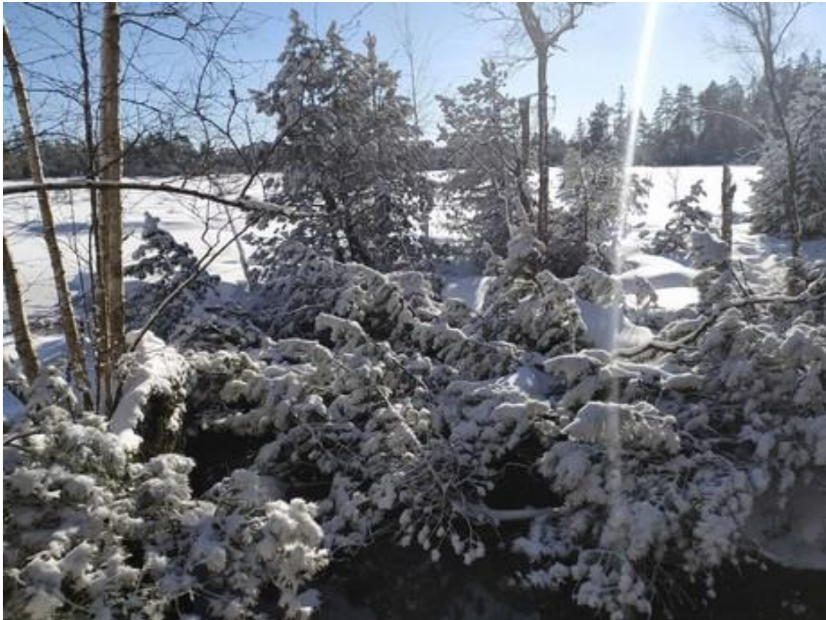
Bergwanderer am Wildseemoor