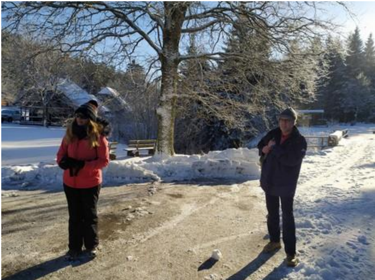
Wanderer am Kaltenbronn