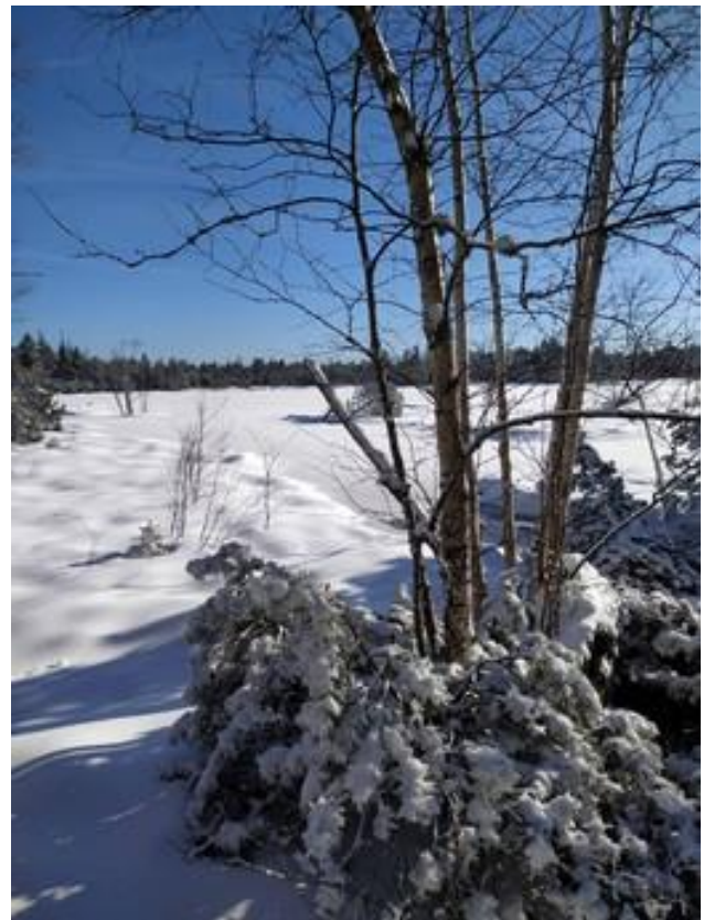
Winterwald am Weg zum Wildseemoor